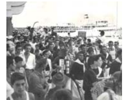
Multitud recibiendo a los campeones en el puerto de Capri.

“En esas aguas cristalinas del Mediterráneo habíamos dado nacimiento al triunfo deportivo más importante de nuestras vidas.”