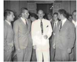
Con el Cónsul Argentino en Italia, en una de las recepciones al campeón y subcampeón mundial.

Hubo exquisiteces para saborear, números artísticos de primera categoría y cantantes italianos de moda; todo amenizado por grandes orquestas y dentro de un ambiente maravilloso y sofisticado que enmarcaba brillantemente nuestra particular hazaña deportiva la que, comunicada a los comensales por los conductores del espectáculo, provocó una fuerte conmoción expresada en calurosos aplausos y fervorosas felicitaciones.