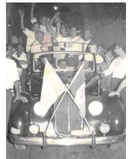
Paseo por las calles de Capri, coronados con las banderas argentinas e italianas.

"El piso era de cristal transparente. Que al mirar a través de él se apreciaba el oleaje del mar y que en la decoración interior nacían y se expandían plantas y palmeras que adornaban magistralmente los espacios."